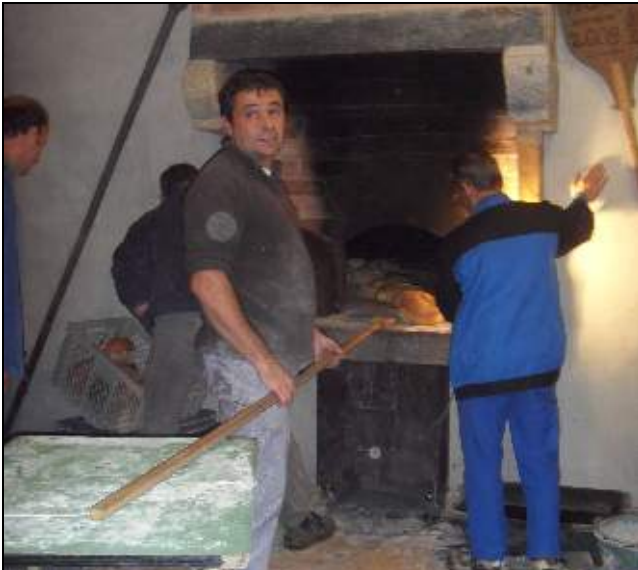
Les boulangers s'activent devant le four

Les bénévoles du comité des fêtes, sous leurs ado-