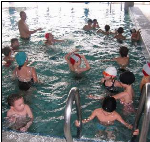
Ça patauge et ça rigole bien à la piscine !