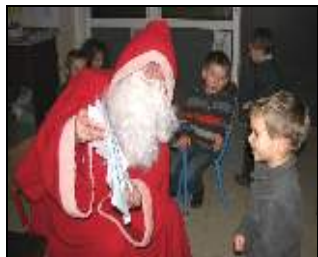
Le Père Noël étudie avec attention chaque dessin des cycles 1

Entre la panne de chaudière et la neige, les élèves ont eu tout de même beaucoup de plaisir dans leur école. Le jeudi 17 décembre 2009, ce fut Noël avant l'heure ! Tout a commencé par la vi-