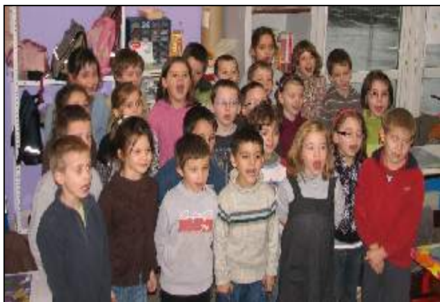
Les enfants du cycle 2 chantent pour le Père Noël