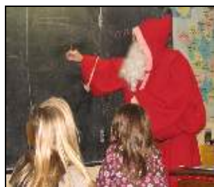
« La terre est ronde ! » explique le Père Noël aux cycles 3

Et ce n'est pas fini... L'après-midi, les MS, GS et CP sont allés voir deux dessins animés au cinéma Saint-Laurent de Blain. Et de quoi parlaient ces films ? De Noël, forcément ! À la sortie des classes, tous les enfants avaient les joues aussi rouges que le manteau du Père Noël... Rouge de plaisir, évidemment !