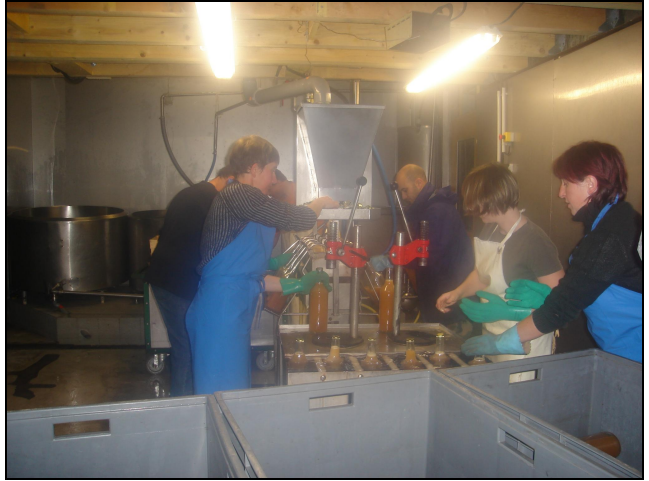
La mise en bouteille

Samedi 31 octobre, une trentaine de parents se sont mobilisés pour mener à