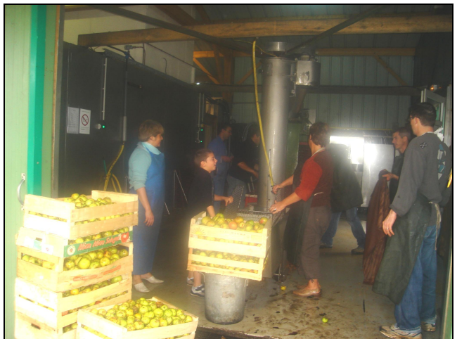
L'ambiance au pressoir fut aussi bonne que le jus de pomme !

roulée en plusieurs étapes, dont l'ultime se déroulait au pressoir de la Grigonnais pour la presse et la mise en bouteille d'un délicieux jus de fruits.