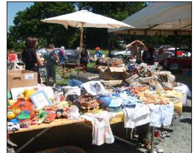
Le stand de l'école a rapporté 230 euros. Bravo aux parents qui l'ont tenu.