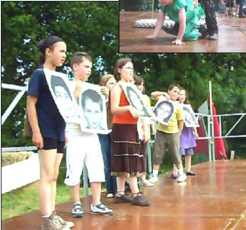
Les grands nous ont offert un spectacle très engagé. Bravo !

Au revoir tout le monde et à l'année prochaine