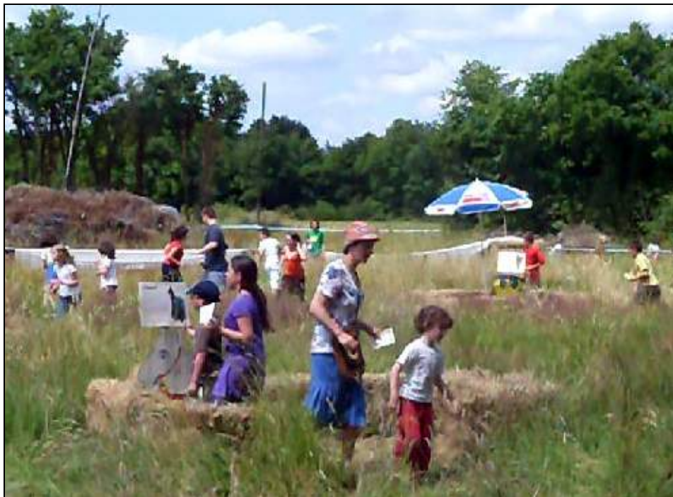
Parents et enfants se sont perdus dans le labyrinthe, mais tout le monde a trouvé la sortie.