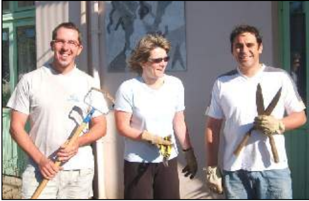
Une équipe de choc pour un désherbage chic !