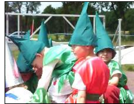
Moment de poésie avec nos petites fées et nos petits lutins

Au revoir tout le monde et à l'année prochaine